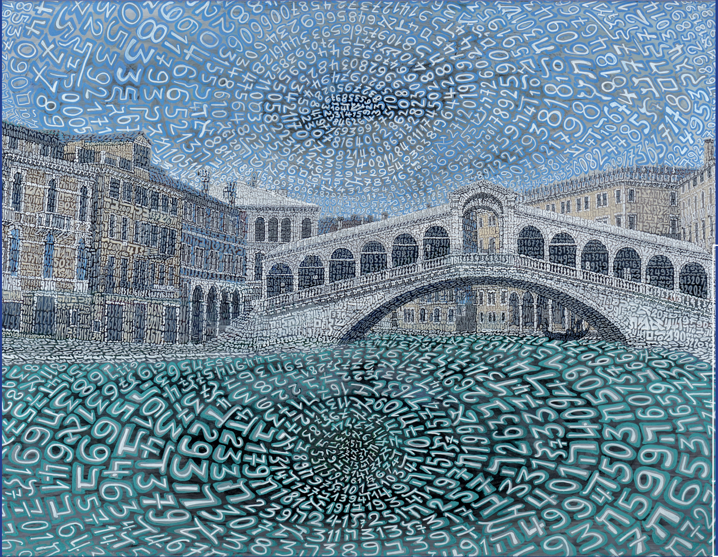
Tobia Ravà: 1404 "Sviluppi a Rivo Alto", 2017.